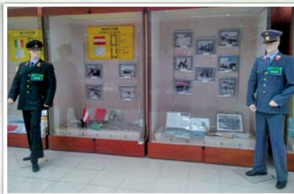
▲ 圖 4 奧地利共和國之警察展櫃