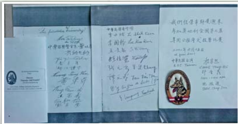
▲ 圖 5 右起：2001 年中華民國警官參加奧地利專用公務警犬技藝比賽簽名字樣；中間：中華民國考察團簽名；左：中華留奧警官生簽名