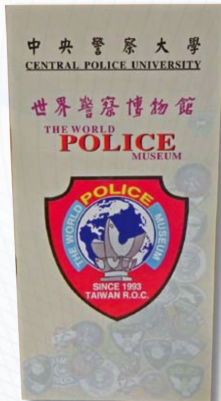
▲ 世界警察博物館的簡介封面

此外，世界警察博物館的簡介封面，是在既有館徽基礎圖騰上再添加新元素，封面所呈現的館徽（如圖 6），融入了加拿大皇家騎警鮮紅色的臂章底色與盾牌式樣。警察臂章的盾牌的意涵，係指警察是社會的盾牌，保護捍衛國家。簡介的封面與內容均經當時的顏前校長核可。