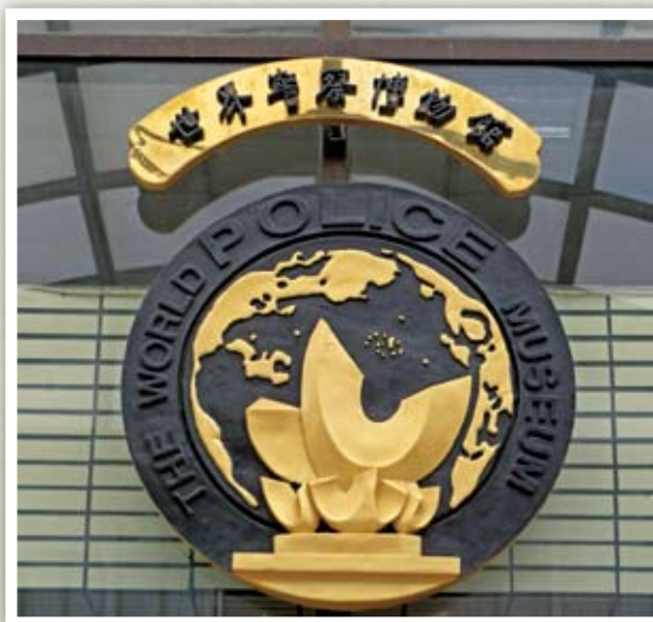
▲ 世界警察博物館大門館徽