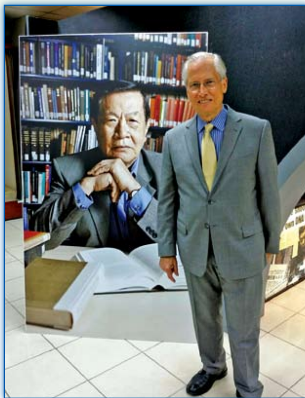
圖 3 Travis 校長與本校傑出校友李昌鈺博士立牌合影