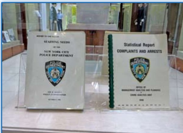
圖 2-2 美國紐約市警察年報 - 投訴與逮捕統計報告