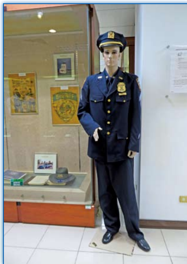
圖 4 美國紐約警察制服（地下 1 樓國際警察館）